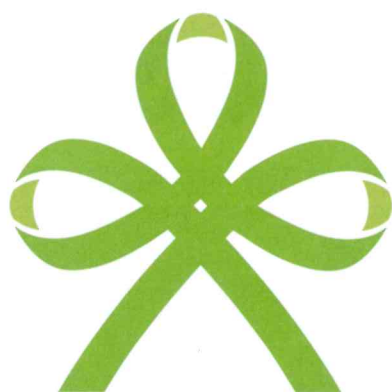
Citrus Ribbon PROJECT

「ふだんの暮らしの幸せ」を揺さぶる新型コロナウイルス。 今こそみんなで支えあい、地域の中で笑顔の暮らしを取り戻そう！